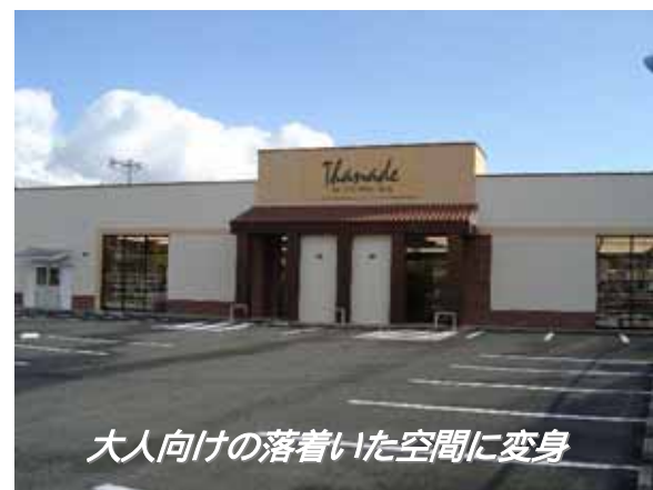
大人向けの落ち着いた空間に変身