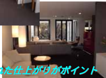
シンプルで洗練された仕上がりがポイント