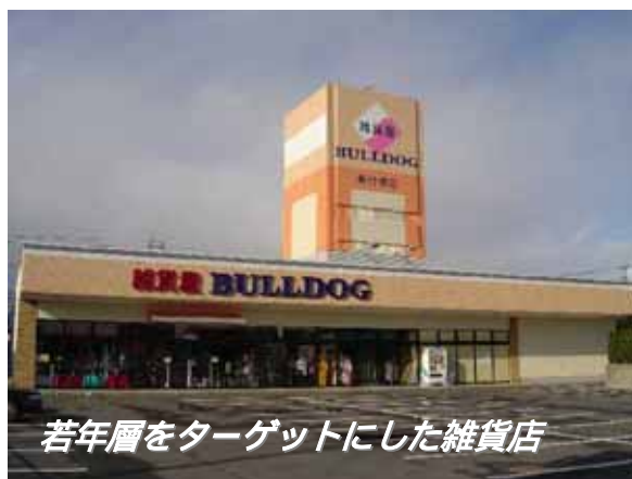
若年層をターゲットにした雑貨店