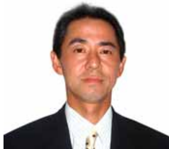
山十(株) 代表取締役

新年おめでとうございます。 旧年中は、格別のお引き立てを賜り、厚くお礼申し上げます。 本年も協力会へのご愛顧とご指導をよろしくお願いいたします。