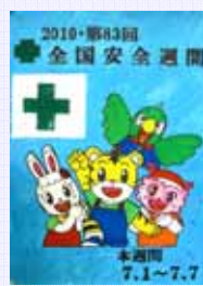
社員家族 川原 智恵