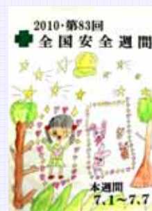
社員家族 川原 彩歌