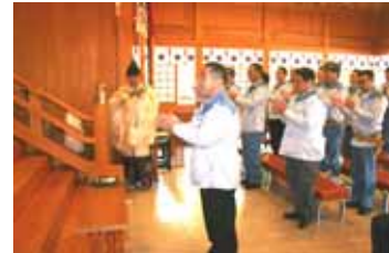
安全祈願 / 戸ノ上神社