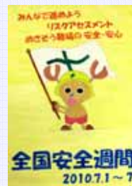
社員家族 上原 亜矢