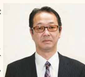
高藤建設安全衛生協会