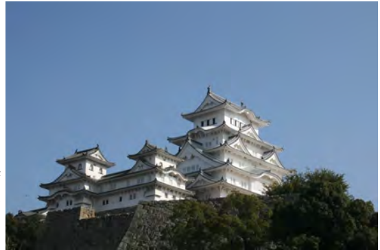
平成の大修理を終えた姫路城