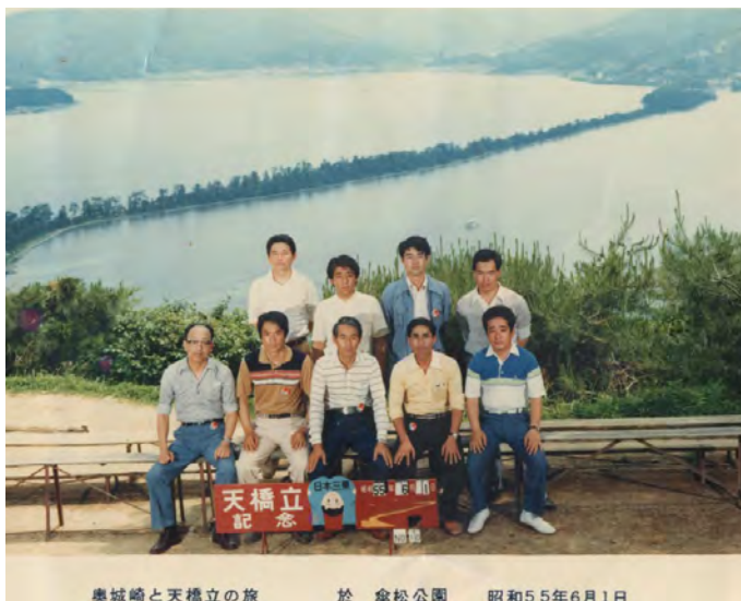
奥城崎と天橋立の旅 於 傘松公園 昭和55年6月1日

バブルに沸きその後バブル崩壊、その折には他の建設会社へ就職した友人達から会社倒産、 リストラ等の連絡を受けるたびに、高藤建設に入社して本当に良かったと実感したことを今でも 思い出します。