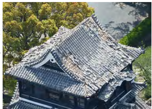
地震で瓦が落ちた熊本城天守閣