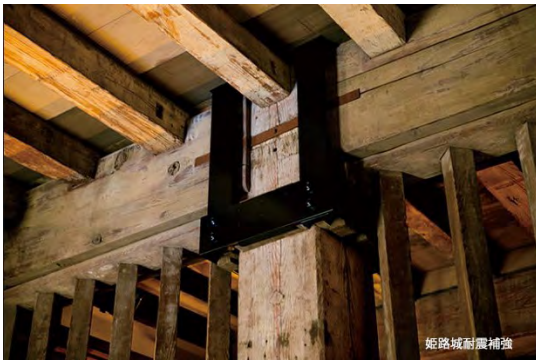
姫路城の耐震補強

熊本城の瓦がほとんど剥がれ落ちたのは“計算済み”だったことをご存知ですか？そこには地震から家屋を守るための先人の知恵が輝いていました。